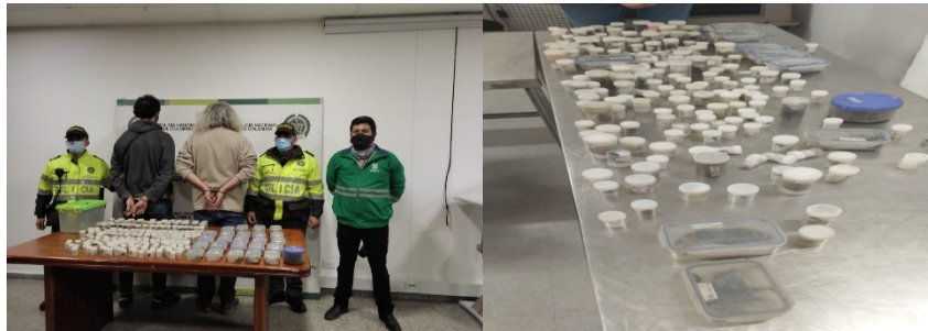
Fotos 8 y 9. Procedimiento de verificación e incautación de 316 artrópodos. Aeropuerto Internacional El Dorado 28.11.2021

El hallazgo se detectó en el área de migración del aeropuerto, como parte del equipaje que acompañaba a dos ciudadanos alemanes, que declararon haber tomado este material con fines académicos para esclarecer su taxonomía. Los dos responsables del hecho se encontraban en territorio colombiano realizando actividades de colecta de especímenes de fauna silvestre sin contar con el respectivo permiso, autorización o licencia expedida por la autoridad ambiental competente.