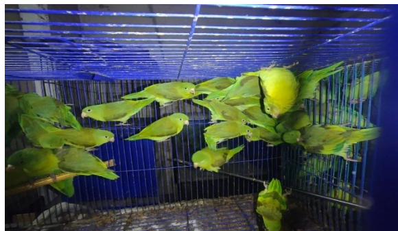
Fotos 1 y 2. Individuos de fauna silvestre recuperados el 23 de febrero de 2022 en bodega de la Urbanización San Luis, aledaña a Plaza de mercado del 20 de julio.

En el segundo operativo, se hallaron 5 individuos vivos de la especie Brotogeris jugularis (Fotografía 3), en un local de la Plaza de mercado El Restrepo, de lo cual quedó constancia en el Acta única de control al tráfico ilegal de flora y fauna silvestre No. 161817 del 09 de diciembre de 2022.