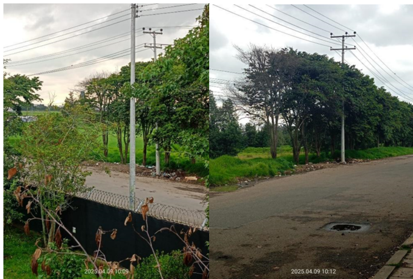
Fotos 6 y 7. Disposición ilegal de residuos sólidos en vía de acceso vehicular al CAVRFFS actualizado al 9-04-2025.

“16. Sírvese informar si el Distrito cuenta con convenios para la recepción, atención o cualquier otro servicio asociado a la protección y bienestar animal con otras entidades territoriales del país.”