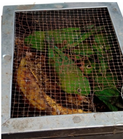
Foto 3. Individuos de fauna silvestre ( Brotogeris jugularis ) recuperados el 9 de diciembre de 2022 en un local de la Plaza de mercado El Restrepo.

En el segundo operativo, se hallaron 5 individuos vivos de la especie Brotogeris jugularis (Fotografía 3), en un local de la Plaza de mercado El Restrepo, de lo cual quedó constancia en el Acta única de control al tráfico ilegal de flora y fauna silvestre No. 161817 del 09 de diciembre de 2022.