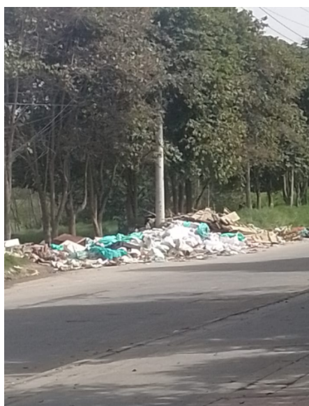
Fotos 4 y 5. Disposición ilegal de residuos sólidos en vía de acceso vehicular al CAVRFFS.

Tras la temporada de lluvias del 2023, se registró un aumento significativo en la presencia de ratones en el Centro de Atención, Valoración y Rehabilitación de Flora y Fauna Silvestre (CAVRFFS). Como respuesta, la Secretaría Distrital de Salud (SDS) realizó una visita el 9 de abril del 2024 para diagnosticar la situación.